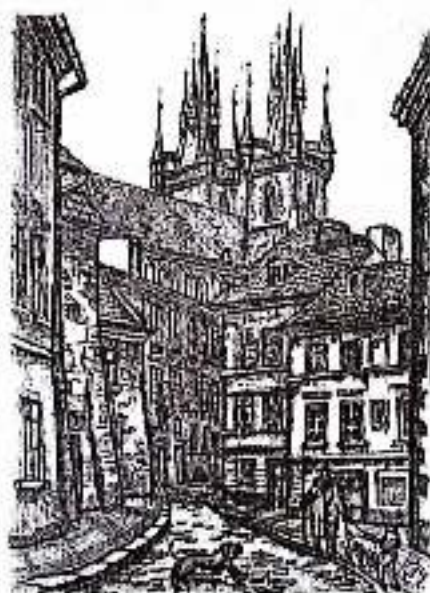
Sector antiguo de Praga. Grabado de autor contemporáneo.

© Spanish translation/traducción al español, Enrique Moya