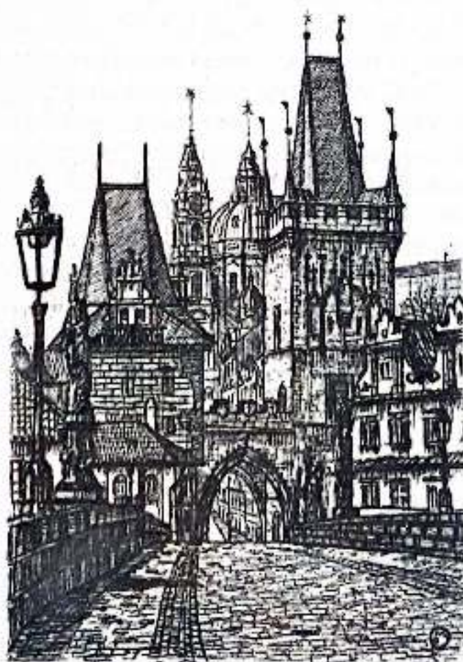
Vista del Puente Carlos hacia las Torres de Malá Strana (Praga). Grabado de autor contemporáneo.