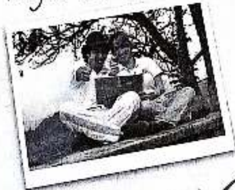
2 de los 200 jóvenes del proyecto Educación que genera progreso para el eje cafetero. ✓