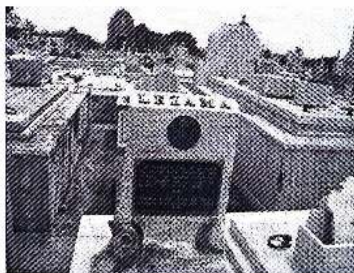
Fig. 2: La tumba de Lezama en el Cementerio Colón

Durante mucho tiempo el testimonio de Fernández Retamar fue la única referencia escrita que se tuvo de la muerte de Lezama, hasta la aparición