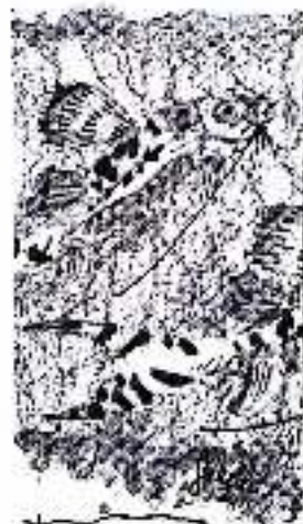
'GATOS' CIENTÍFICO: 'PUMELONES PICTUS' COMÚN: GATO PUMELONERA 25cm. ACUARELA MICROPUNTA LAPIZ COLOR LAPIZ 6H ANGIUSTO GABRIELLI ARQUITECTO/PINTOR BOGOTÁ 6 #2 70 18 JULIO 2011