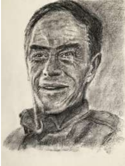
Carlos Alberto Ospina-Herrera Obra de Pilar González-Gómez