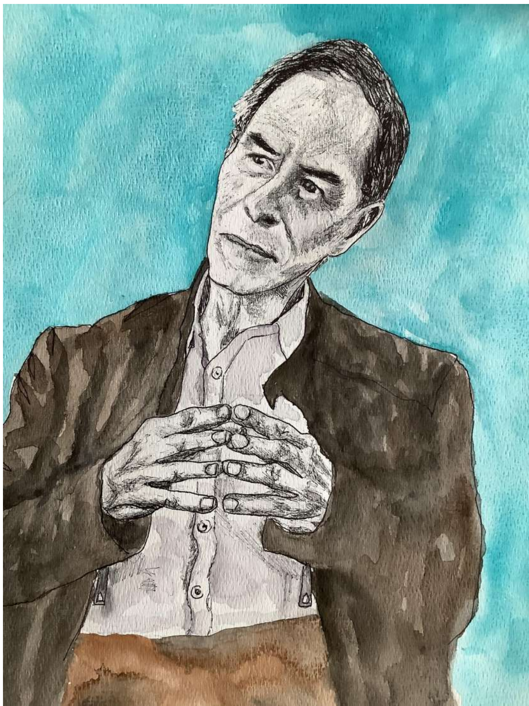
Carlos-Alberto Ospina H. – Obra de Pilar González-Gómez