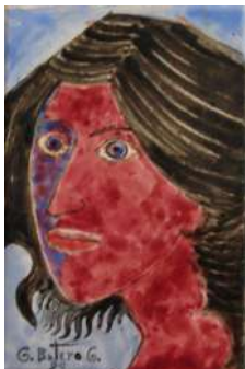
Guillermo Botero G. Cerámica, original de 15 x 23 cms. (Colección Aleph)