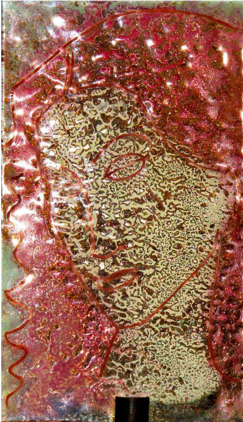
Guillermo Botero G. Obra experimental en vidrio, de 15x25 cms. (Colección Aleph)